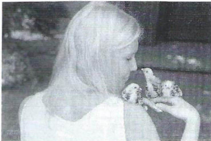
Ik samen met de kleintjes die afgelopen mei geboren zijn.

Op zaterdag 7 mei was ze daardan, samen met haar broers en zusters is ze geboren in Haaksbergen bij fokker Harry te Lintelo. Een paar weken later kwamen ze bij ons. De familie was compleet met mama kip, papa kip en elf kleintjes. Met veel verwennen en liefde hebben ze bij mij, mijn zus en mijn ouders gewoond en zijn heel oud geworden. Voor ons maakt het dan ook niet uit of ze mooi zijn, als ze maar een goed hart hebben.