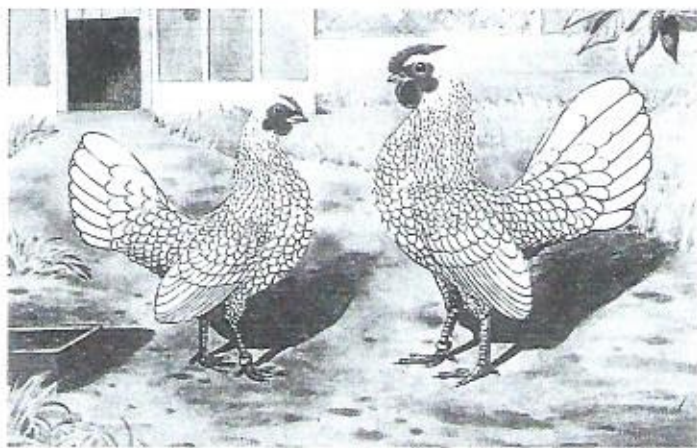
Silber-Sebright. W. Bürger 1952 (gültiges Musterbild des Clubs)

Tegenwoordig speelt het hoen en speciaal de haan in Frankrijk een belangrijke rol. Hij is het wapendier van Frankrijk en ontbreekt bij geen enkele Franse voetbalinterlandwedstrijd als geluksbrenger.