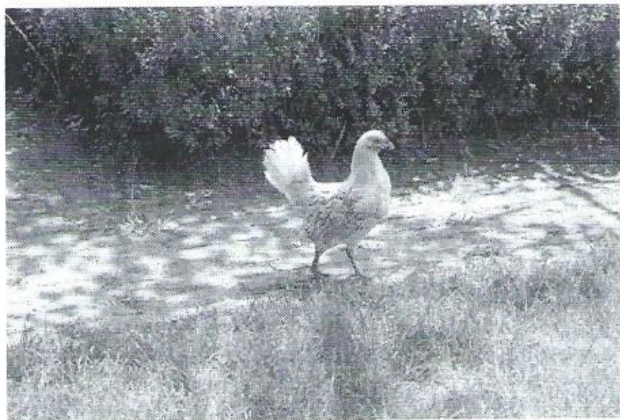
Mary in de tuin (2014)

Ze slaapt veel en slaapt het liefste uit. Als ze wakker wordt rond een uur of 10 / 11, begint ze zacht te piepen. Dit is het teken dat ze graag wil dat het gordijntje voor haar hok wordt weggehaald, zodat het licht genoeg is om van de stok af te komen en lekker te ontbijten. Elke ochtend krijgt Mary een biscuitje. Deze wordt gedrenkt in water totdat het koekje geheel zacht is, anders wil ze het koekje niet. Als ze klaar is met haar ontbijt gaat ze in de deuropening van haar hokje zitten en schreeuwt ze. Dit is het teken dat ze uit haar hokje gehaald wil worden. Ze kan zelf best wel vliegen, maar wil liever gedragen worden. Als het mooi weer is gaat ze lekker met ons naar buiten en bij minder mooi weer zit ze bij ons in de kamer op een kattenkrabpaal of naast een van ons op de leuning van een stoel.